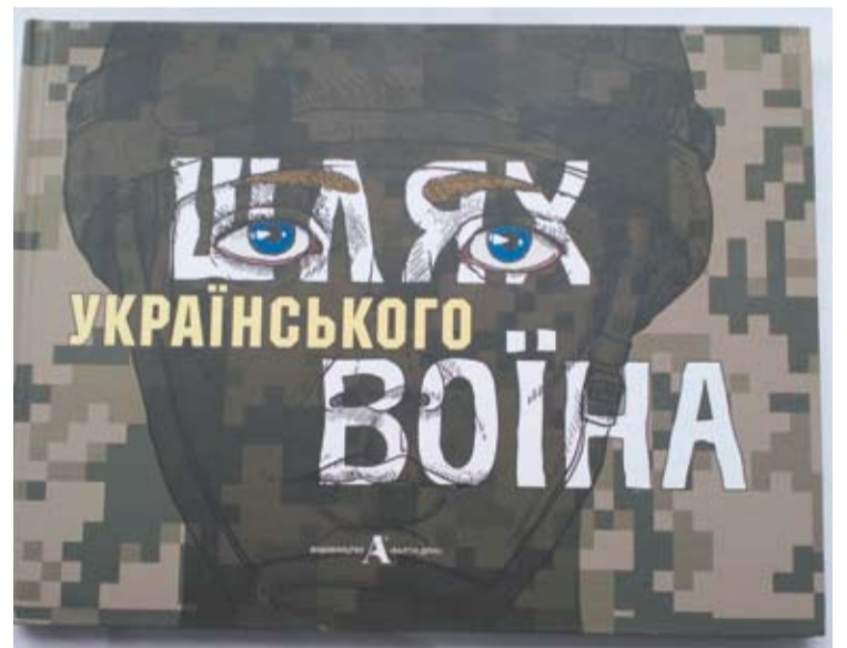
Karys Ukrainos kariuomenei skirtos knygos viršelyje.

Kariuomenę populiarinančios knygos tiražas vos 1000 egzempliorių, tačiau leidėjai viliasi, kad pavyks parduoti ir išleisti antrąjį, išplatinti bent jau 3000 knygų. Kijeve veikiančios leidyklos metai buvo vidutiniški. Pavyko išleisti tris knygas. Pirmosios dvi - Ukrainos papuošalų istorija bei Žymiausių Ukrainos istorijoje moterų enciklopedijos pirmasis tomas.