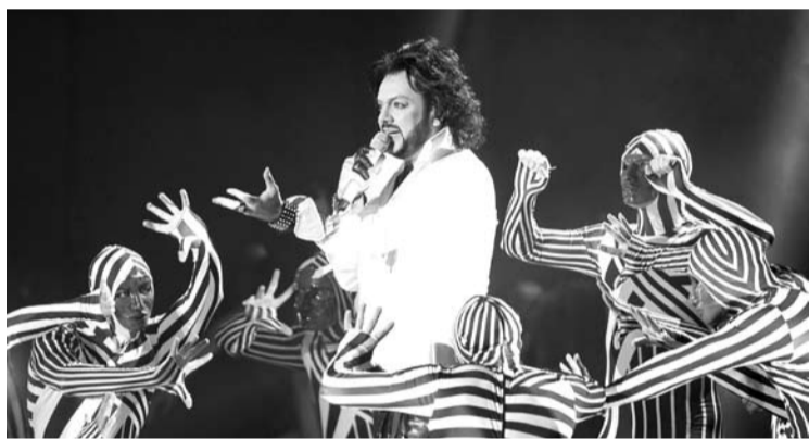
Atlikėjui Filipui Kirkorovui gali būti uždrausta atvykti į Lietuvą.