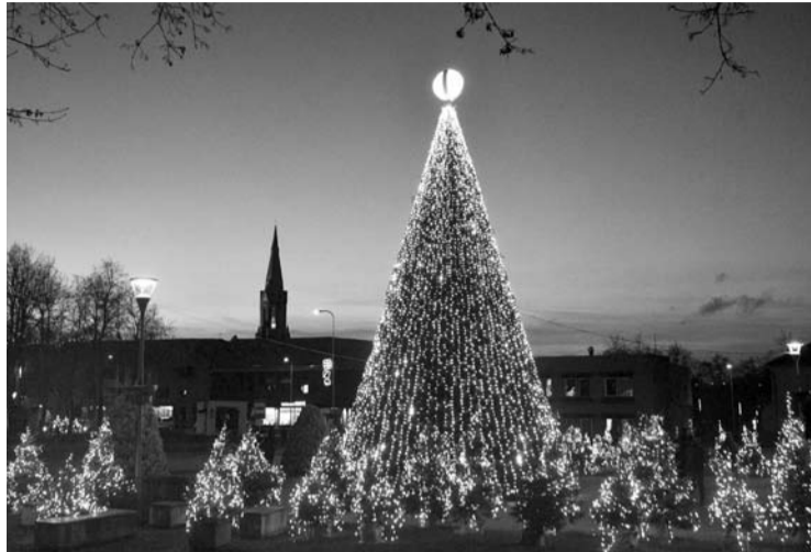
Savivaldybė siekia, kad žmonės galėtų kuo ilgiau pasidžiaugti Anykščių žaliaskare.

Priminsime, kad Anykščių rajono tarybos sprendimu rajo-