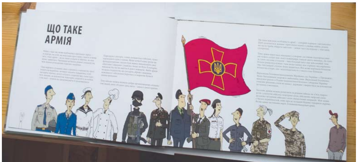
Knyga iliustruota smagiais dailininkės Irenos Panarinos piešiniais.